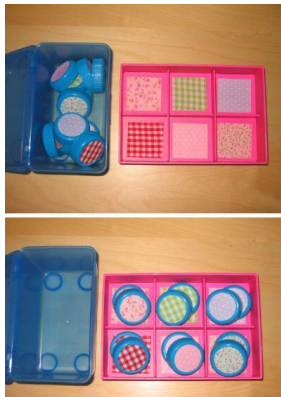
Des jeux de table type memory, domino