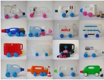
Des jeux en lien avec l'imaginaire de l'enfant