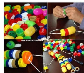
Des objets à tirer à base de bouchons