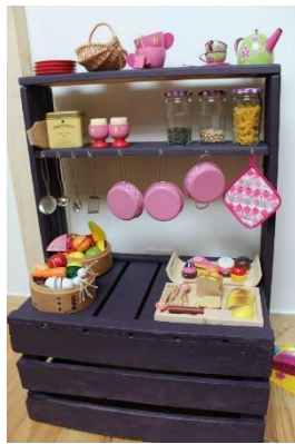
Des dinettes ou autres coins symboliques